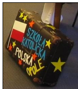
Pierwsza walizka z Polski

Wszyscy Wolontariusze Taporu w Polsce życzą Wam Szczęśliwych Świąt Wielkanocy!