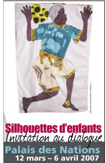
Plakat wystawy po francusku

"Kiedy robiliśmy nasze sylwetki, dostrzegaliśmy jak jesteśmy różni i to pomagało nam szanować się nawzajem. Kiedy czytaliśmy nasze wiadomości, dorośli mogli zdać sobie sprawę, że nadal są problemy do rozwiązania. "